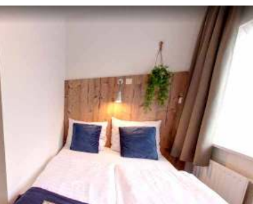
Double Room Small