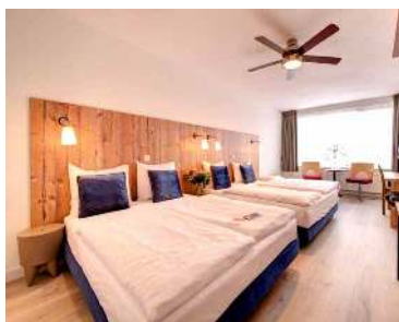
Family Room Large